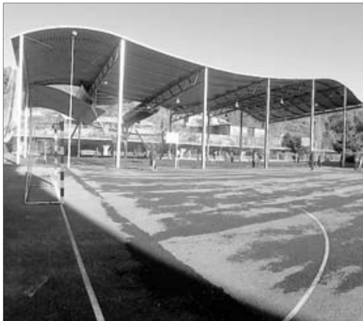
La cancha cubierta del colegio.