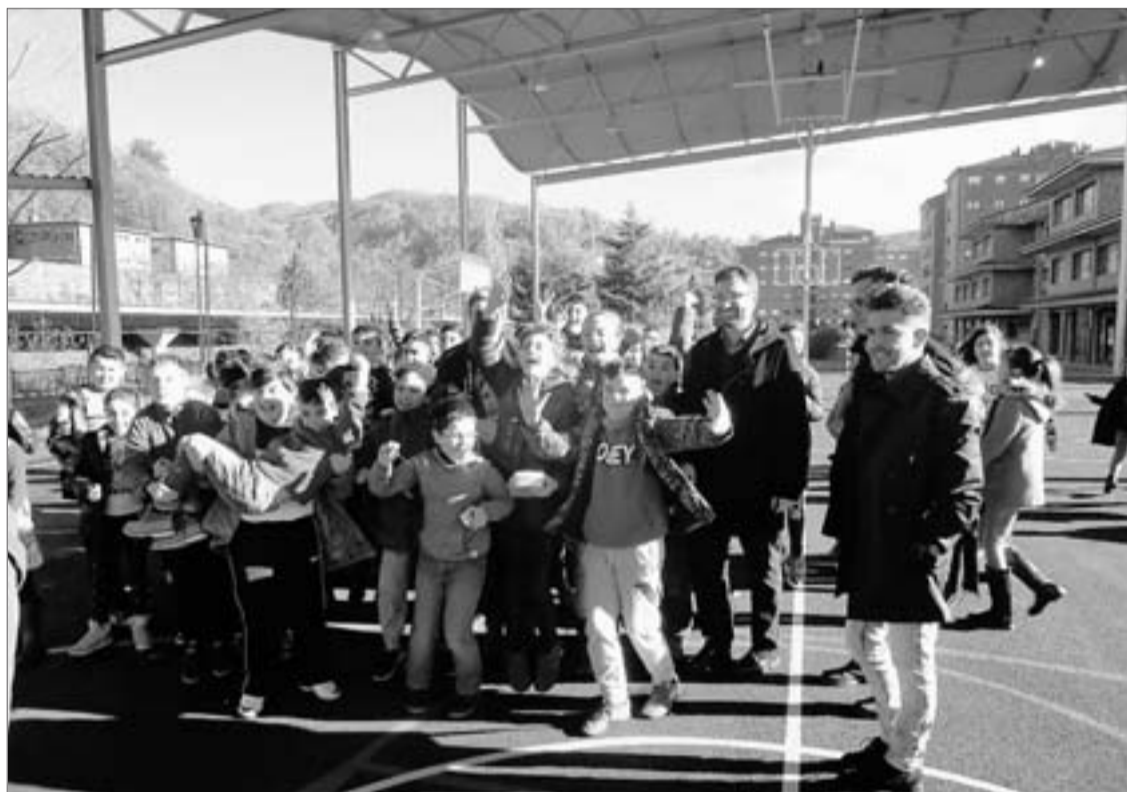
Alumnos del colegio público El Coto con el Alcalde, bajo la nueva pista cubierta.